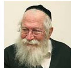
הרב גולדברג. רעידת אדמה?

הפסיקה ההלכתית לפיה יכול יהודי שומר תורה ומצוות לחתום על כרטיס אדי, נאמרה מפי הרב גולדברג על רקע אישור הכנסת את חוק "מוות מוחי נשימתי" לפני שלושה חודשים. החוק הועבר על מנת לאפשר תרומת איברים גם בקרב הציבור החרדי והדתי, ועל פי הנחיות הלכתיות ברורות המובנות בגוף החוק.