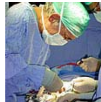
חוק ההשתלות הטבות כספיות ואחרות לתורמי אברים מהחי

במהלך היסטורי אישרה היום הכנסת שני חוקים שמסדירים את תחום השתלות האברים בישראל. החוק הראשון קובע הטבות לתורמי אברים מן החי. השני, חוק קביעת מוות מוחי, קובע כי מוות מוחי נחשב למוות לכל דבר. חוק זה, ביוזמת ח"כ עתניאל שנלר, בשיתוף רופאים ורבנים, אמור להכשיר את השתלות האברים גם בקרב אלו שהתנגדו לכך עד עתה מטעמים דתיים