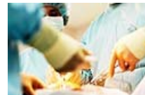
תרומת אברים: התשובות לכל השאלות ששאלתם