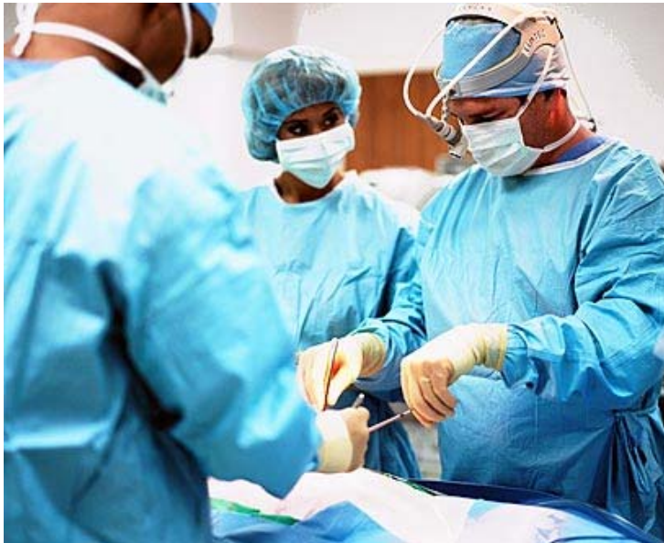
"הכנסת חוקה היום חוק אשר יגרום לשינוי חינוכי"

ורפלקסים נוספים). בתוך כך, הפסקת פעילות המוח תיקבע באמצעות בדיקה במכשירים אובייקטיביים (דוגמת מכשיר ה-CFM הבודק פעילות חשמלית מוחית).