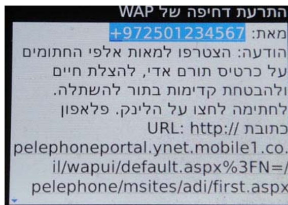
תוכן ההודעה שתתקבל ב-SMS

בימים הקרובים יקבלו לקוחות פלאפון הודעת SMS בנוסח: "הצטרפו למאות אלפי החתומים על כרטיס אדי להצלת חיים ולהבטחת קדימות בתור להשתלה. לחתימה לחצו על הלינק ". בהליך מהיר, דרך הטלפון ניתן יהיה לחתום על כרטיס תורם איברים.