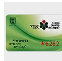
כרטיס אדי. אלף איש ממתנים להשתלת איברים