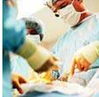
משפחת האישה שעברה השתלת כליה עברה מסרבת להציל חיים של אחרים